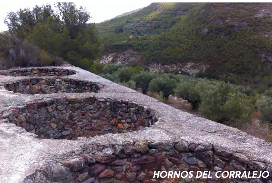
HORNOS DEL CORRALEJO