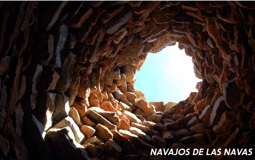
NAVAJOS DE LAS NAVAS

SE DEDICA DESDE EL AÑO 2010 A PROTEGER, RECUPERAR, REHABILITAR Y ACRECENTAR EL PATRIMONIO NATURAL Y CULTURAL ALTURANO. NAVAJOS, CORRALES, MASÍAS, FUENTES, POZOS, ALMAZARAS, TRULES, CALERAS, REFUGIOS, ÁRBOLES SINGULARES, CRUCES MEDIEVALES, TORCAS... SON LOS OBJETOS DE ACTUACIÓN DE LA ASOCIACIÓN. NUESTRO PATRIMONIO ES NUESTRA IDENTIDAD COMÚN MODELADA A LO LARGO DE SIGLOS, ES LO QUE NOS DEFINE COMO PUEBLO EN RELACIÓN CON NUESTRO ENTORNO. ES NECESARIO DAR A CONOCER DICHO PATRIMONIO PARA DESPERTAR LA CONCIENCIA SOCIAL PARA VALORARLO Y PROTEGERLO. A ESE FIN SE DIRIGE LA SEÑALIZACIÓN DE ESTAS RUTAS Y A REIVINDICAR LA DIGNIDAD DE NUESTROS ANTEPASADOS EN SU LUCHA POR LA VIDA ADAPTÁNDOSE AL MEDIO HOSTIL EN EL QUE VIVIERON Y LA DE SU ABNEGADO TRABAJO PARA TRANSFORMAR ESE MEDIO HOSTIL Y HACERLO HABITABLE.