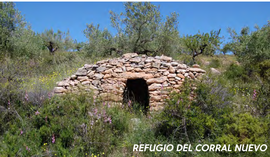
REFUGIO DEL CORRAL NUEVO