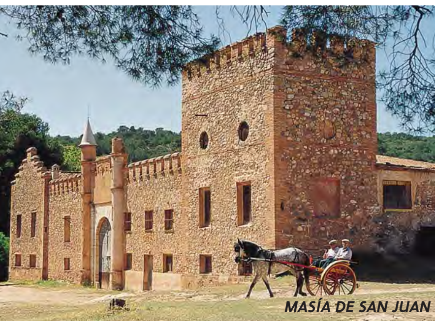
MASÍA DE SAN JUAN