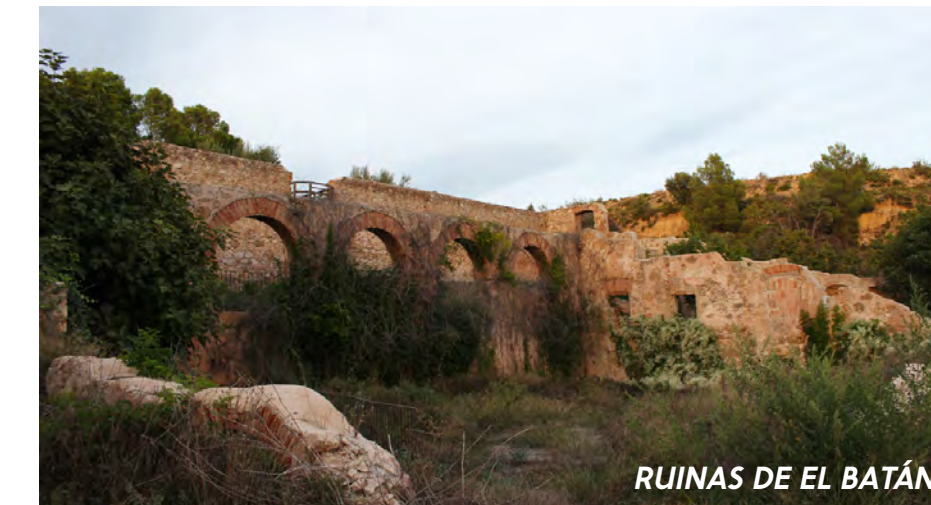
RUINAS DE EL BATÁN