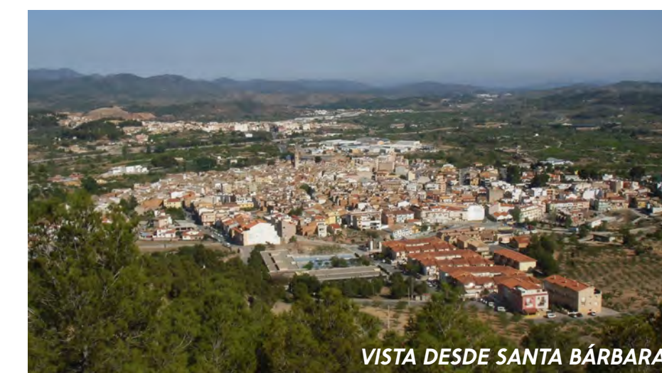
VISTA DESDE SANTA BÁRBARA