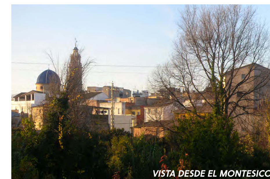
VISTA DESDE EL MONTESICO